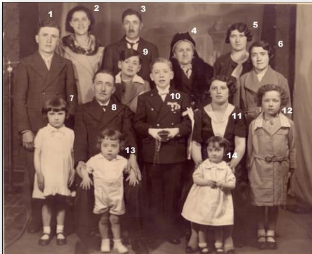
La famille de Frédéric Farigoule

René, le troisième enfant de Rosine, ne figure pas sur cette photo car il n'est pas encore né.